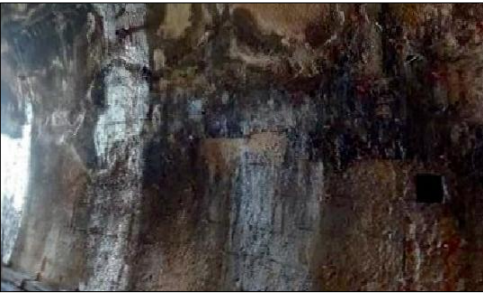
Danno B2 - Fessure diffuse, bagnate